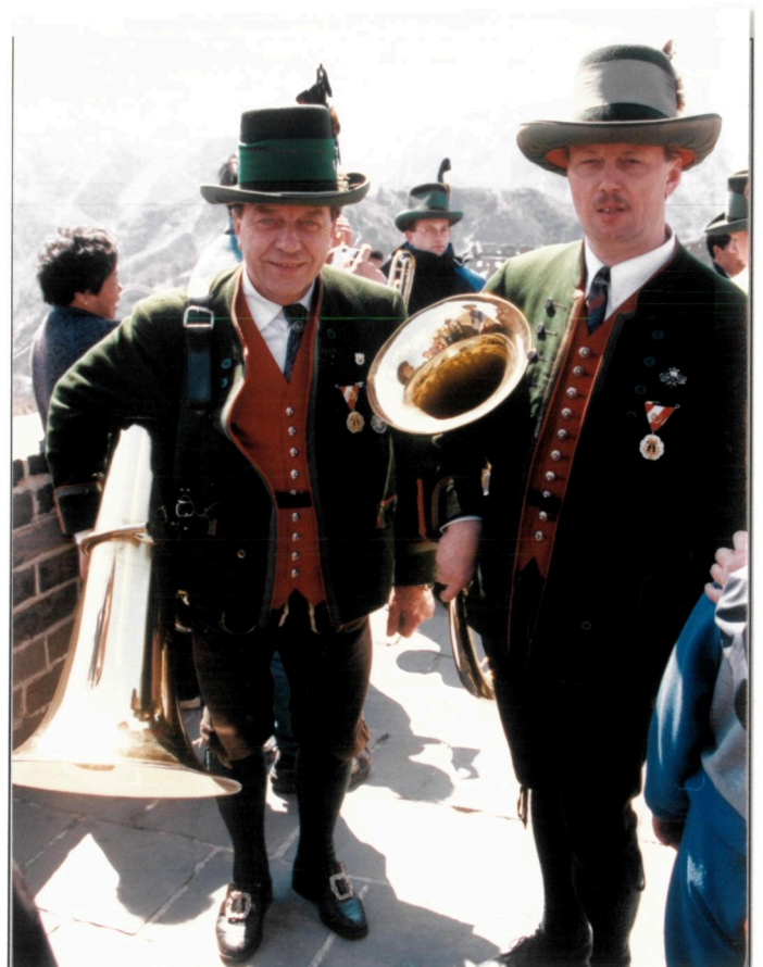
Zwei müde „Mauer“-Musikanten bei einer kurzen Rast