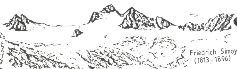
Friedrich Simony (1813-1896)